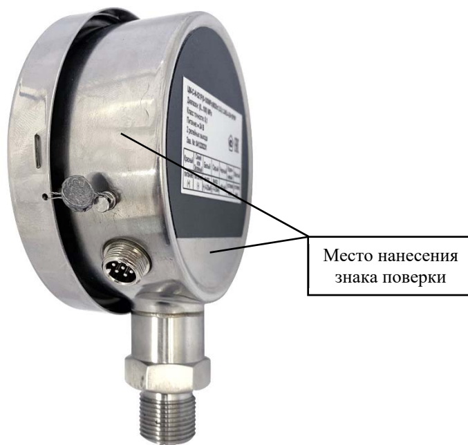
Рисунок 1 – Обозначение возможных мест нанесения знака поверки

10.3 Знак поверки наносится на корпус манометров, в соответствии с рисунком 1.